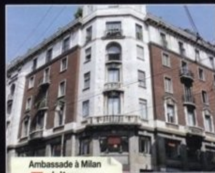
Ambassade à Milan 5 visiteurs par jour*

Ce 5 juin, 65 personnes sont entrées dans cet immeuble de huit étages abritant différents lobbys, mais aucune ne se rendait à la maison languedocienne.