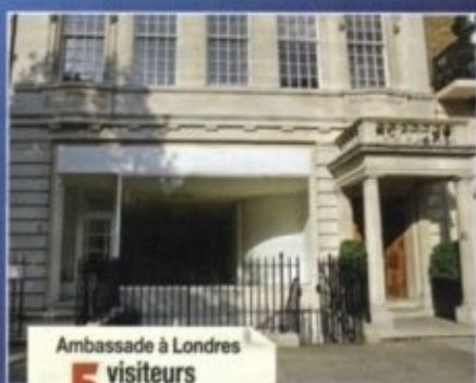
Ambassade à Londres 5 visiteurs par jour*

Au rez-de-chaussée de l'un des immeubles les plus chers de la ville, elle a été inaugurée par Georges Frêche, le président du conseil régional, en novembre 2007.