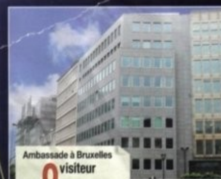
Ambassade à Bruxelles 0 visiteur

Derrière une vitrine chic proche de Regent Street, cette maison dédiée au vin et au tourisme a vu sept visiteurs le 2 juin et trois le lendemain.