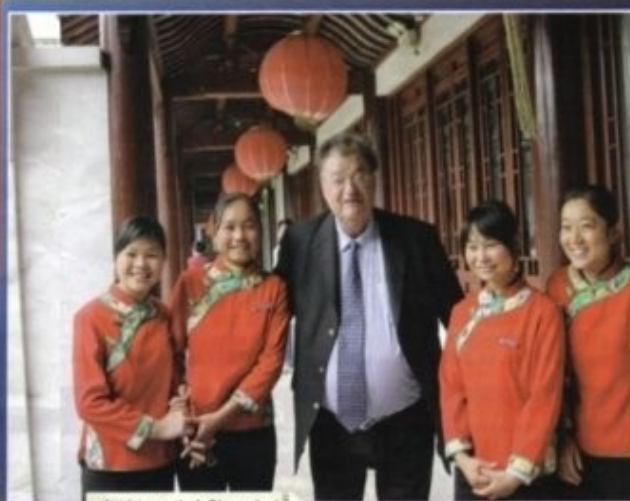
Ambassade à Shanghai 5 visiteurs par jour*

Au rez-de-chaussée de l'un des immeubles les plus chers de la ville, elle a été inaugurée par Georges Frêche, le président du conseil régional, en novembre 2007.